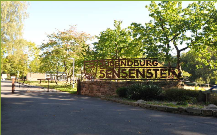
Unser neues Ziel: Burg Sensenstein bei Kassel

Wenn Sie ihr Kind gerne selber fahren wollen, so informieren Sie uns im Vorfeld darüber, damit wir besser planen können.